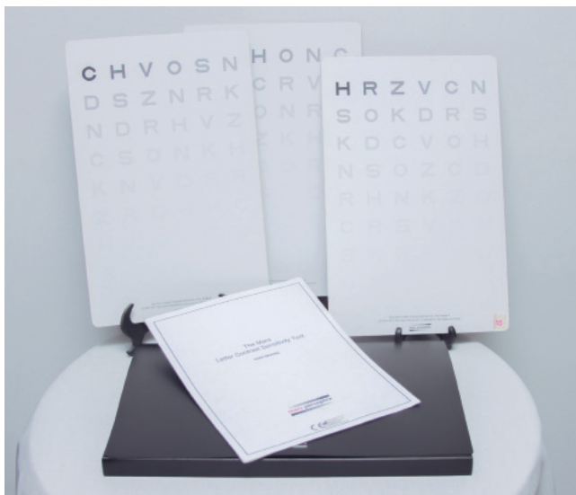
Figura 1. Prueba MARS (Mars Letter Contrast Sensitivity Test).

La sensibilidad al contraste es el poder de resolución del ojo para discriminar un objeto con respecto al fondo (8). La mayoría de los trastornos oculares asociados con la baja visión pueden afectar la sensibilidad al contraste, además de la agudeza visual. Una adecuada evaluación de la sensibilidad al contraste permite discriminar la dificultad de un paciente con baja visión para detectar objetos con diferentes grados de contraste e iluminación. Para evaluar la sensibilidad al contraste, están: la gráfica de Pelli-Robson (12), la prueba MARS ( Mars Letter Contrast Sensitivity Test ) (figura 1) (13), la prueba de sensibilidad al contraste de Vistech y la F.A.C.T.® ( Functional Acuity Contrast Test ) (8).